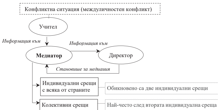
Фигура 2. Механизъм на взаимодействие и роля на образователния медиатор в училище

В контекста на разработения концептуален модел и в подкрепа на заявената цел на разработката за участие в проучването е привлечен действащ образователен медиатор 5 . В своята практика той най-често съдейства за решаването на казуси, възникнали на територията на образователната институция с характер на междуличностен конфликт. Това са конфликти между ученици или между ученик(ци) и учител. Утвърденият механизъм за решаване на такива казуси в тази образователна институция е визуализиран във фиг. 2.