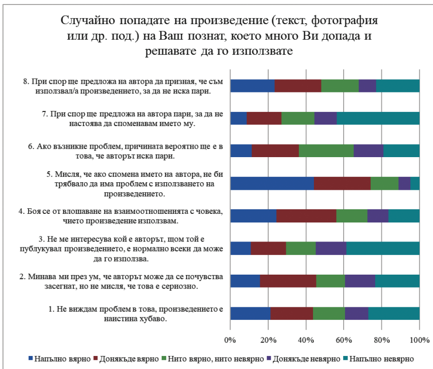
Фигура 1. Разпределение на отговорите на въпросите по Казус 1